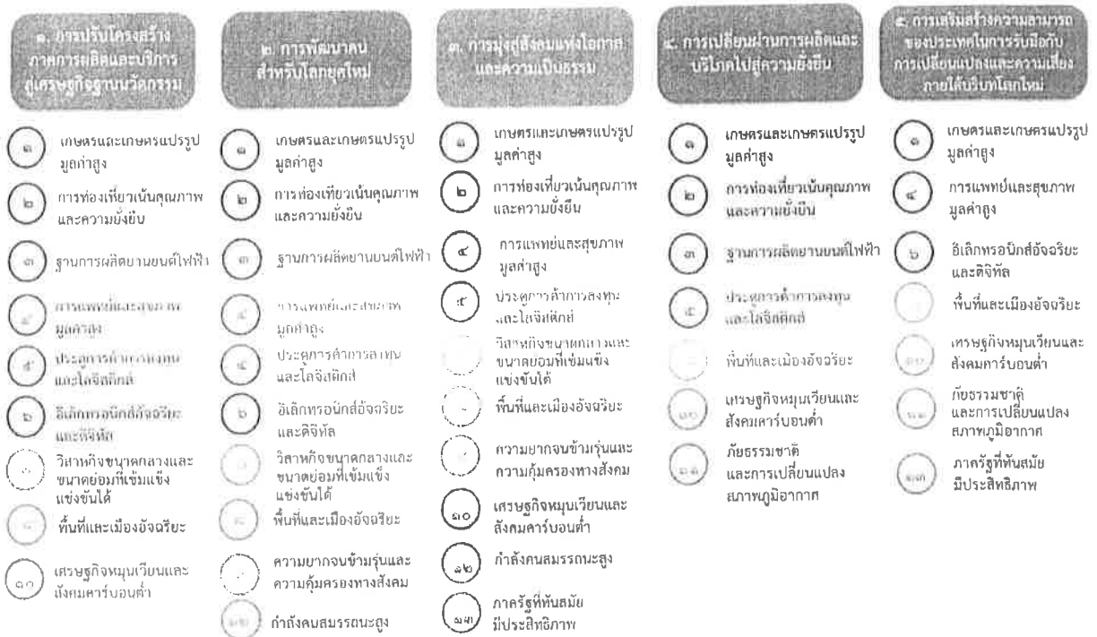
แผนภาพที่ ๓.๑ ความเชื่อมโยงระหว่างหมวดหมู่การพัฒนากับเป้าหมายหลัก

ความเชื่อมโยงระหว่างหมวดหมู่การพัฒนากับเป้าหมายหลักแสดงไว้ในแผนภาพที่ ๓.๑ โดยหมวดหมู่ การพัฒนาที่กำหนดขึ้นเป็นประเด็นที่มีลักษณะเชิงบูรณาการที่ครอบคลุมการพัฒนาตั้งแต่ในระดับต้นน้ำจนถึงปลายน้ำ และสามารถนำไปสู่ผลพัฒนาทั้งในมิติเศรษฐกิจ สังคม ทรัพยากรธรรมชาติและสิ่งแวดล้อมไปพร้อมๆ กัน ทำให้หมวดหมู่แต่ละประการสามารถสนับสนุนเป้าหมายหลักได้มากกว่าหนึ่งข้อ นอกจากนี้การพัฒนากายใต้แต่ละหมวดหมู่ ไม่ได้แยกขาดจากกัน แต่มีการสนับสนุนหรือเอื้อประโยชน์ซึ่งกันและกัน